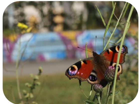
Tagpfauenauge, Lene Voigt Park, Leipzig.

Der Bereich sollte idealerweise 20x25 Meter groß sein. Falls die von Ihnen ausgewählte Grünfläche schmaler ist kann der Bereich auf 10x50 Meter oder 5x100 Meter angepasst werden.