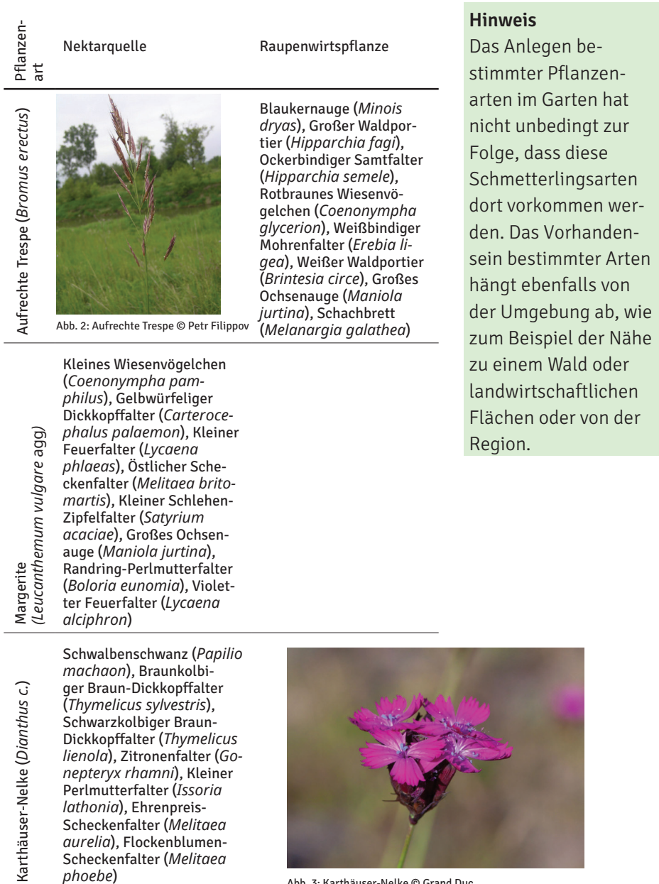
Abb. 2: Aufrechte Trespe