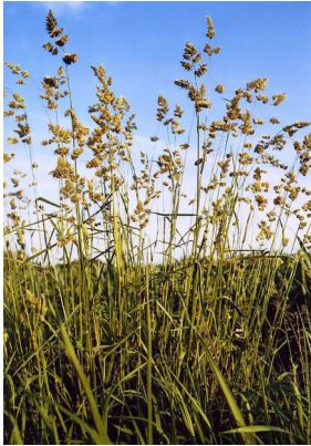
Abb. 4: Wiesen-Knäuelgras