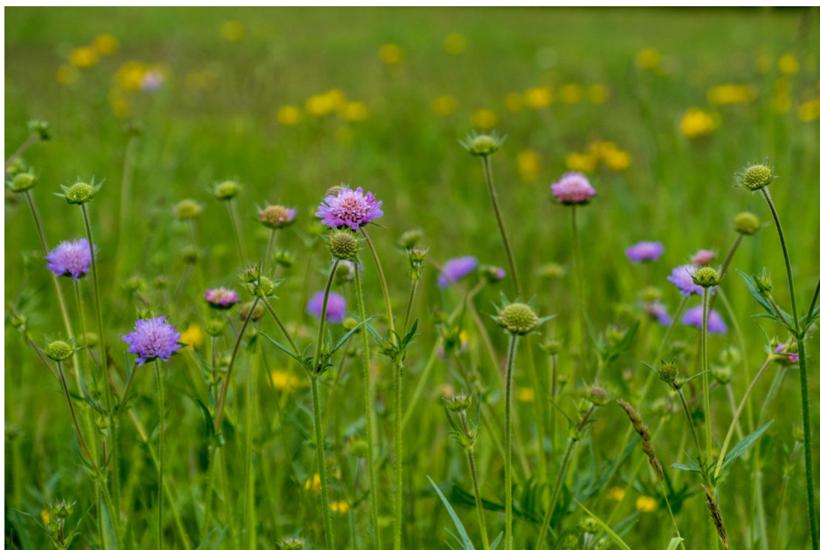
Abb. 1: Wiesen-Witwenblume

ungestört, mit wenigen Schnitten entwickeln zu können. Auch Bereiche, die ihr häufig abläuft, sind eher nicht geeignet. Dort solltet ihr lieber widerstandsfähigen Rasen säen.